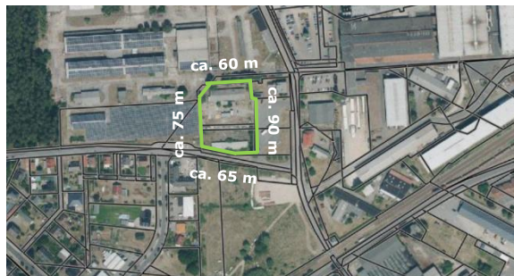
Luftbild - vermaßt